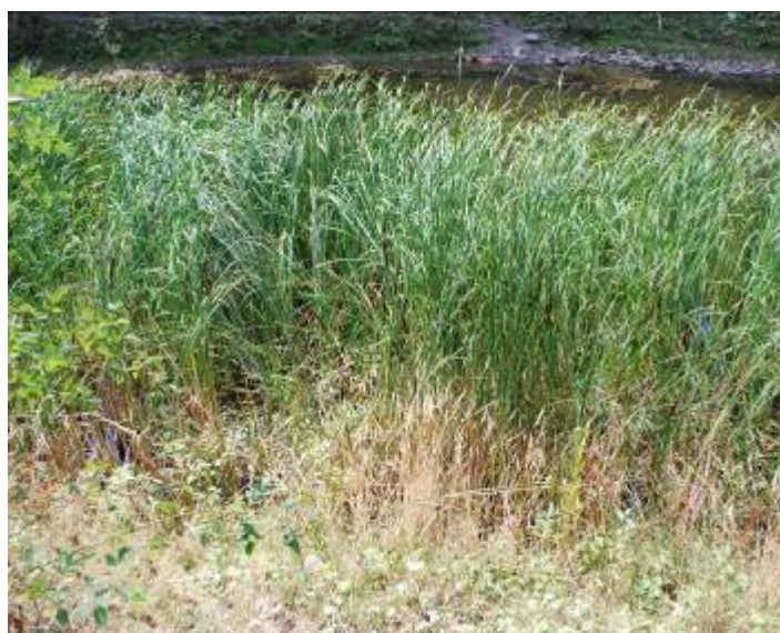
Fig. 7. Centura de papură de la lacul stația 11

Din acest lac am recoltat papură pentru a fi renaturalizat Lacul Verde de la stația 13 ( fig. 7 ).