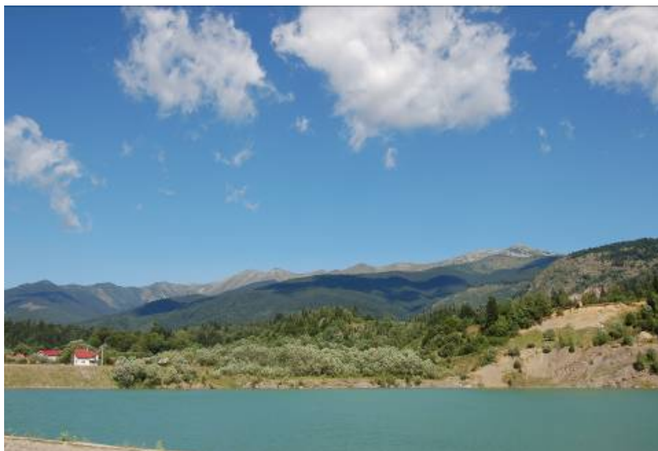
Fig. 1. Lacul de la Câmpu lui Neag

În uriașele gropi lăsate în urma exploatărilor miniere de suprafață a fost introdusă apă sau s-a acumulat din apele de șiroire și din cea meteorică. Lacul de la Câmpu lui Neag are maluri dalate și este folosit ca lac de agrement ( fig.1. ).