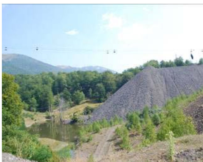
Fig. 6. Lacul de la tericon în curs de colmatare

Dintre lacurile menționate, au fost alese ca obiect de studiu pentru reabilitare doar cele de la Lupeni, excluzând lacul de «la tericon» care este în curs de colmatare cu steril (fig. 6).